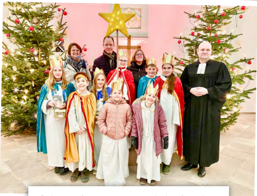
Birkenauer Sternsinger im evangelischen Gottesdienst