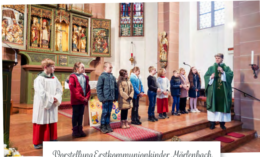
Vorstellung Erstkommunionkinder Mörlenbach