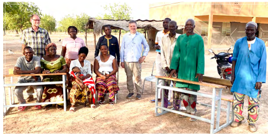
Schulbesuche auf den Dörfern, Gespräche mit Lehrpersonal und Elternvertretern.