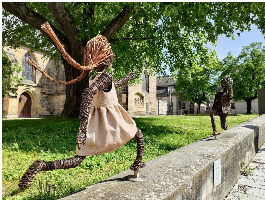
Irgard Wissing (Künstlerin)