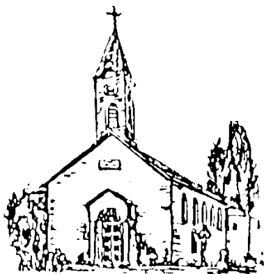
St. Theresia Hallbergmoos

PFARRVERBAND HALLBERGMOOS Sonntag 14.12.2025 bis Sonntag 11.01.2026 3./4. Advent WEIHNACHTEN/ FEST DER HL.FAMILIE/ HEILIG DREIKÖNIG